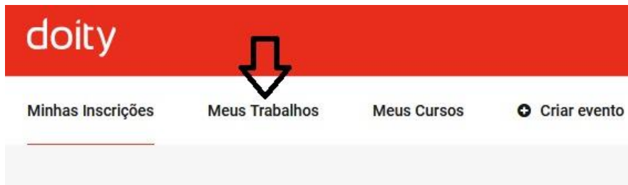
Figura 2 – Link do menu para acessar seu artigo (trabalho)

11. Após a avaliação do seu artigo, você receberá um e-mail “Submissão de trabalho” do evento, com os pareceres dos avaliadores;