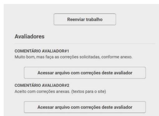
Figura 3 – Parte do e-mail recebido pelo autor para acessar as correções e reenviar o artigo revisado.

12. Ao ser “Aceito com modificações”, você deverá visualizar as correções/sugestões do(s) avaliador(es), conforme a (Figura 3) abaixo;