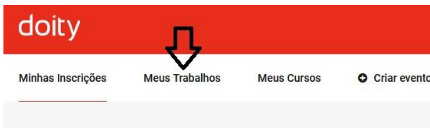
Figura 2 – Link do menu para acessar seu artigo (trabalho)